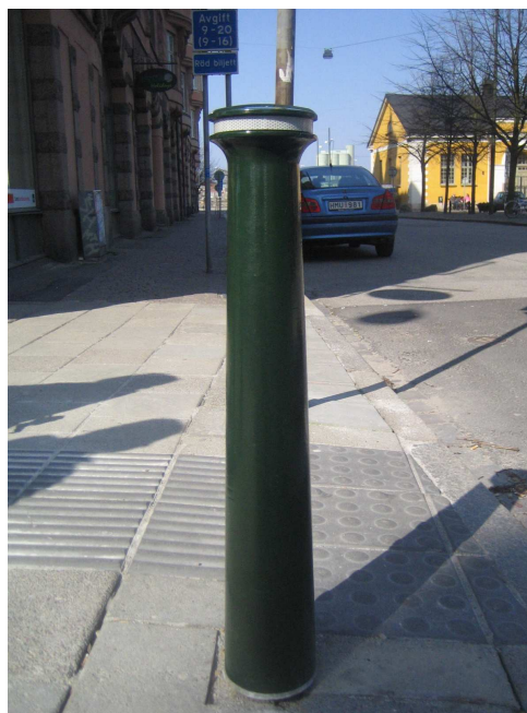
Färgen återkommer på en belysningsstolpe.