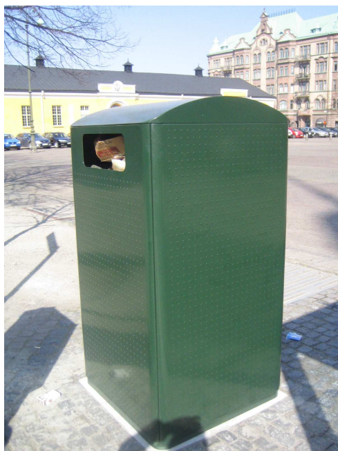
En grön soptunna som står på torget.

stenbeläggningsen på torget och den historiska karaktären som byggnaderna runtomkring bildade.