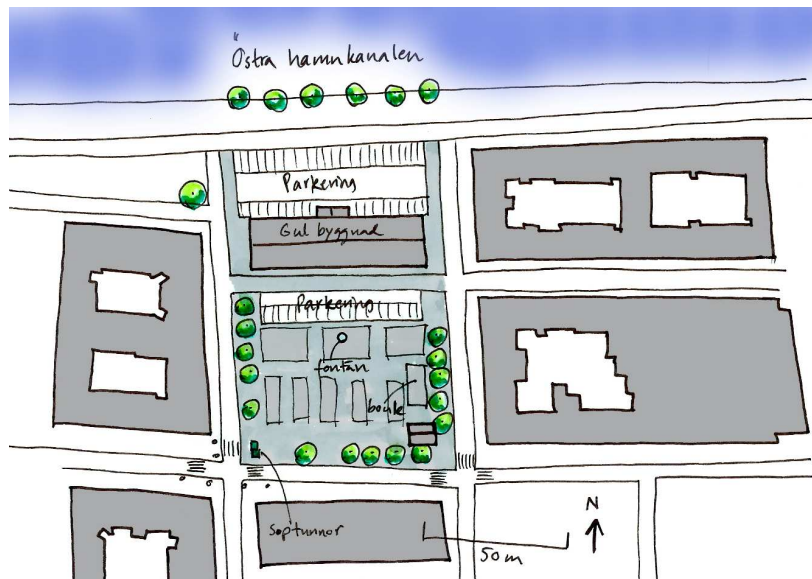
Planskiss över Drottningtorget.

verksamhet. Huset på långsidan mittemot är en kontorsbyggand från 1960-talet och på torgets båda kortsidor finns ljusa bostadshus från förra sekelskiftet.