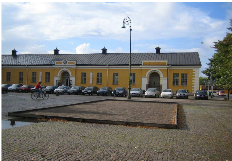
Drottningtorget i Malmö med den gula regementsbyggnaden i bakgrunden.

Torget markbeläggning består av grå gatsten. Mitt på torget står en fontän i sten och framför den gula byggnaden finns en parkering. På torgets ena kortsida finns en boulebana och på den andra står två stora soptunnor. Soptunnorna som är mörkgröna är placerade i hörnet ut mot gatan. Vid ett övergångsställe i närheten av torget återkommer samma gröna färg på en belysningsstolpe. Möblerna har den typiska mörkgröna Malmöfärgen som är vanlig på bänkar och papperskorgar i många svenska stadsparker.