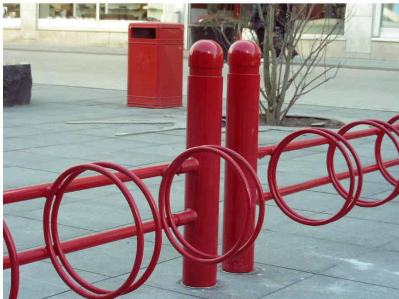
De röda cykelställena är dominerande på platsen och skapar en tydlig kontrast mot markbeläggningen och husfasaderna.

Jag upplevde Dragarbrunnstorg som en livfull och händelserik plats. Eftersom torget ligger centralt är det många människor som uppehåller sig eller passerar förbi det. Jag tyckte att de röda möblerna gjorde platsen intressant och spännande och jag upplevde en tydlig kontrast mellan den röda färgen, markbeläggningen och husfasaderna. Den röda färgen kändes stark och dominerande på platsen samtidigt var den uppiggande och gav ett glatt intryck. Den röda färgen är det starkaste elementet på torget som får det att hålla samman i ett rum. Jag fick en positiv bild av torget och den röda färgen tilltalade mig.