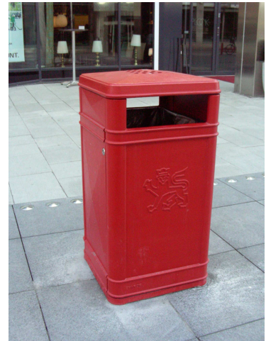
Dragarbrunnstorg i Uppsala med gallerian till vänster i bild. En röd soptunna.

Jag upplevde Dragarbrunnstorg som en livfull och händelserik plats. Eftersom torget ligger centralt är det många människor som uppehåller sig eller passerar förbi det. Jag tyckte att de röda möblerna gjorde platsen intressant och spännande och jag upplevde en tydlig kontrast mellan den röda färgen, markbeläggningen och husfasaderna. Den röda färgen kändes stark och dominerande på platsen samtidigt var den uppiggande och gav ett glatt intryck. Den röda färgen är det starkaste elementet på torget som får det att hålla samman i ett rum. Jag fick en positiv bild av torget och den röda färgen tilltalade mig.