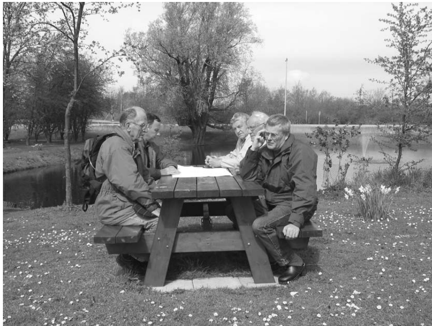
Figur 9. Möte mellan parkansvarig och brukare i parken.

I inledningsskedet av fallstudien gjordes intervjuer med enskilda medlemmar av föreningen. Därefter gjordes vid ett par tillfällen intervjuer med flera ur föreningen samtidigt ute i parken. Vid varje tillfälle valde föreningen att bjuda in den ansvariga parktjänstemannen på kommunen. Mitt intryck från dessa möten var dels att det rådde samstämmighet mellan föreningen och parktjänstemannen, dels att man från föreningens sida ville markera att det inte fanns några konflikter mellan kommunen och föreningen.